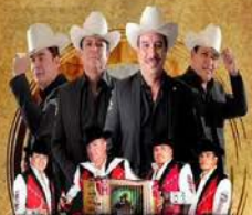
ALEGRES DEL BARRANCO Y MORROS DEL NORTE