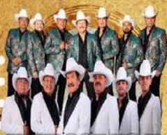
INVASORES Y CARDENALES