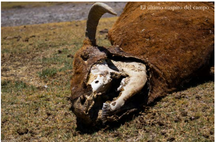
El último suspiro del campo