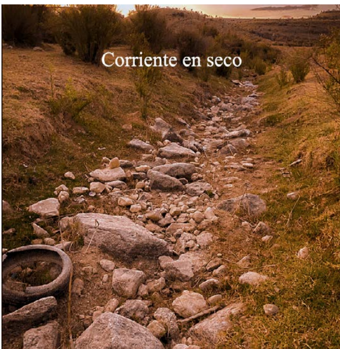
Corriente en seco