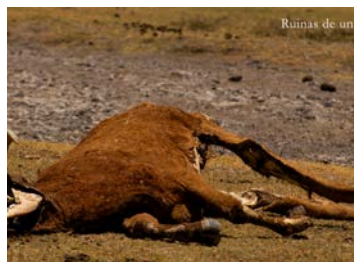
Ruinas de un