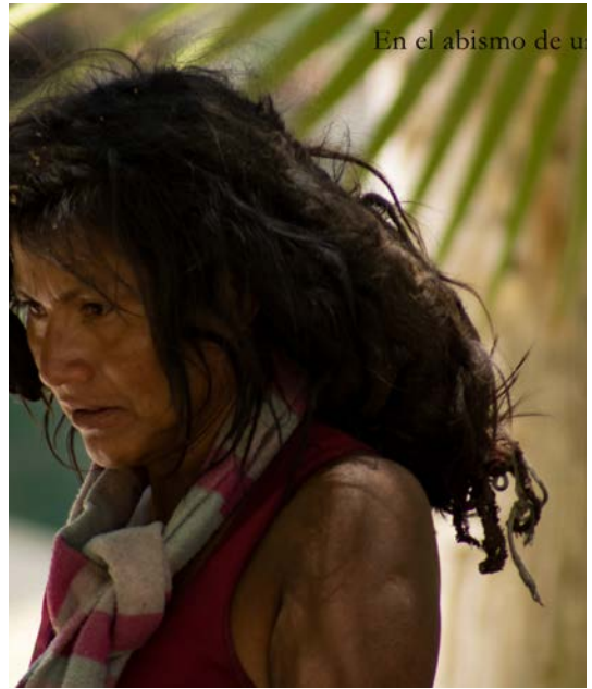
En el abismo de u