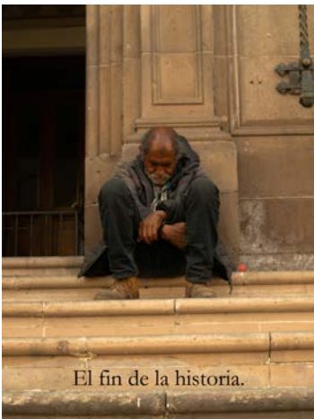
El fin de la historia.