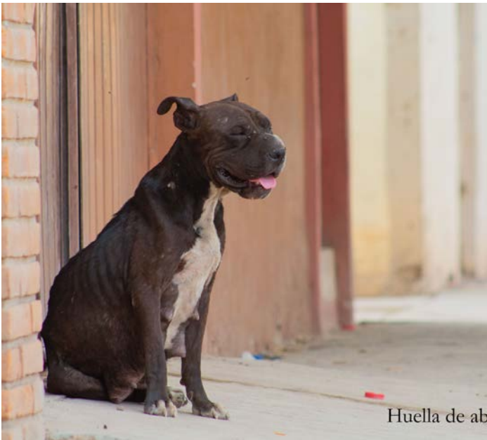
Huella de ab