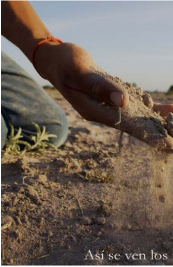
Así se ven los