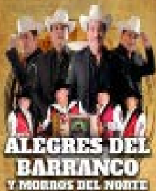
ALEGRES DEL BARRANCO Y MORROS DEL NORTE