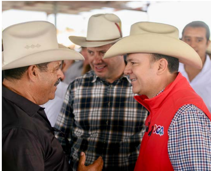
Santiago Papasquiaro, Dgo

Con el apoyo del Gobierno del Estado que encabeza Esteban Villegas, los ganaderos y agricultores de Santiago Papasquiaro han recibido una ayuda invaluable a través de programas que mitigan la sequía y mejoran la genética de los sementales. Uno de los principales beneficios ha sido la entrega de semilla de avena certificada a un precio casi regalado, lo que ha sido recibido con gratitud por las familias del campo.