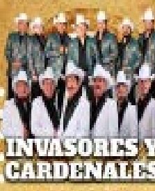
INVASORES Y CARDENALES