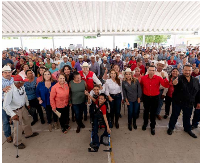
Simón Bolívar, Dgo.

“Lo que queremos es transformar vidas, por eso estamos aquí,” expresó el gobernador Esteban Villegas Villarreal, acompañado de su esposa Marisol y parte de su Gabinete Estatal, al entregar diversos apoyos asistenciales en el municipio de Simón Bolívar. Entre los apoyos se incluyen sillas de ruedas PCI, andaderas, bastones, muletas, lentes y apoyos alimentarios, además de acciones de infraestructura y servicios básicos.