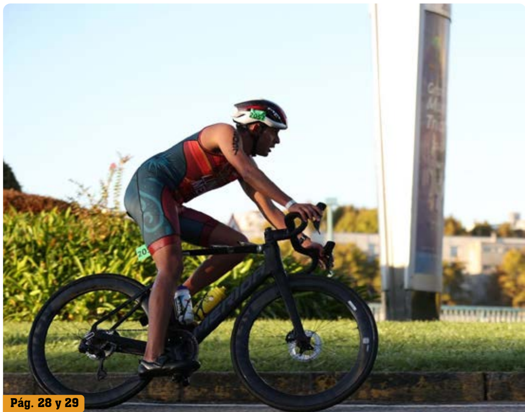
Pág. 28 y 29